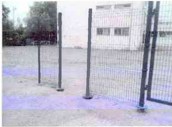
№1 вход на территорию