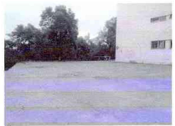
№4 пути движения на территории