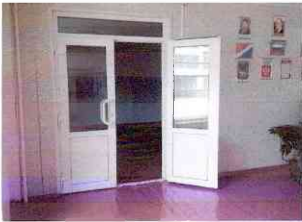
№13 дверь в вестибюле, выход на лестницу и к кабинету