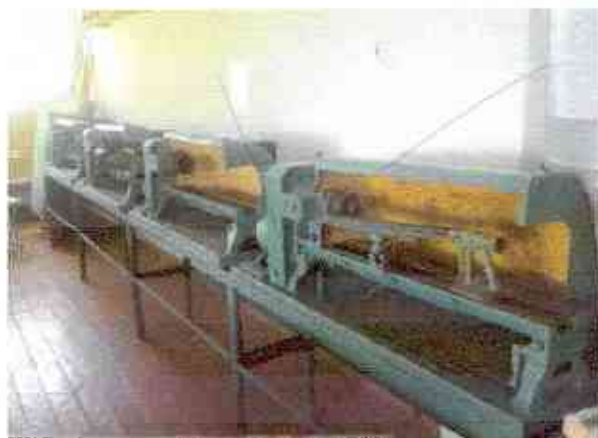
№22 кабинет технического труда