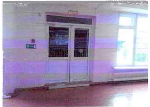
№10 вход в вестибюль