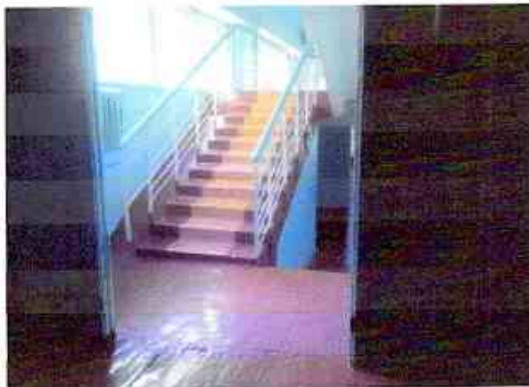
№11 лестница входная здания