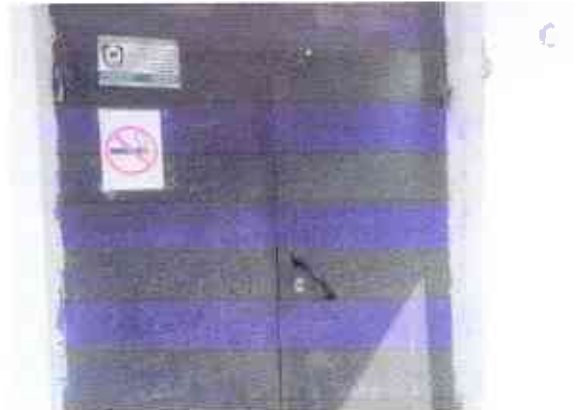
№6 дверь входная