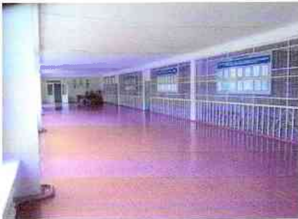
№9 зона ожидания, вестибюль