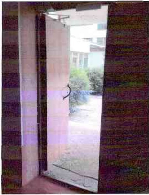
№7 дверь входная