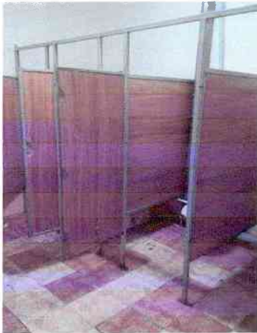
№15 туалетная комната