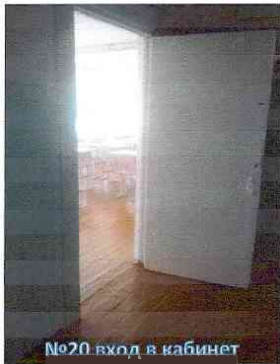
№20 вход в кабинет