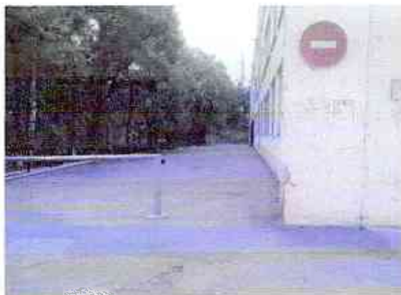
№3 пути движения на территории