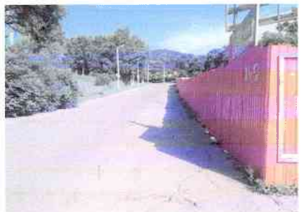
№18 подход к школе