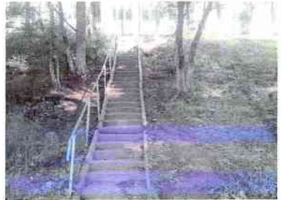
№2 вход на территорию