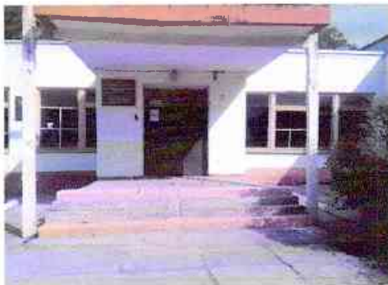
№5 вход в здание