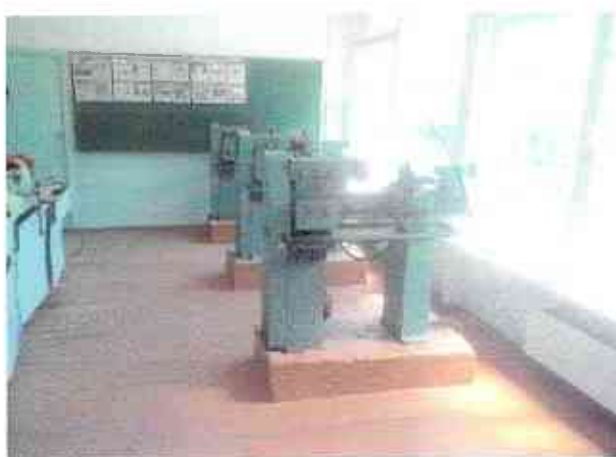
№23 кабинет технического труда