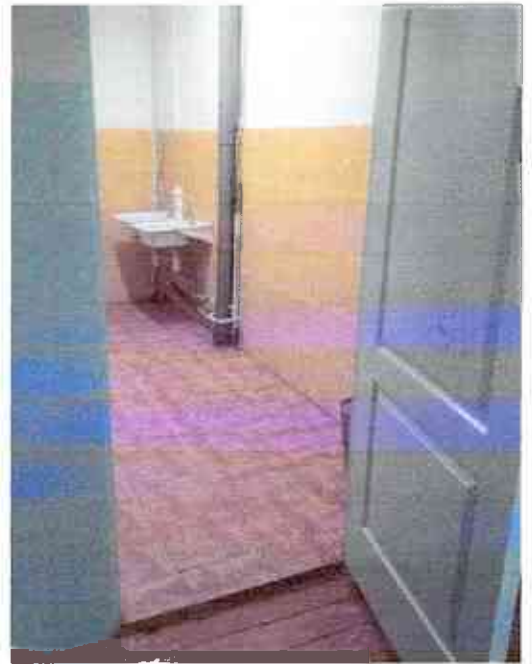
№14 туалетная комната