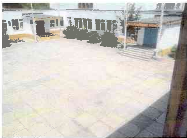
№19 территория двора