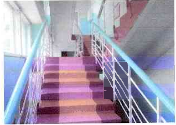
№12 лестница входная здания